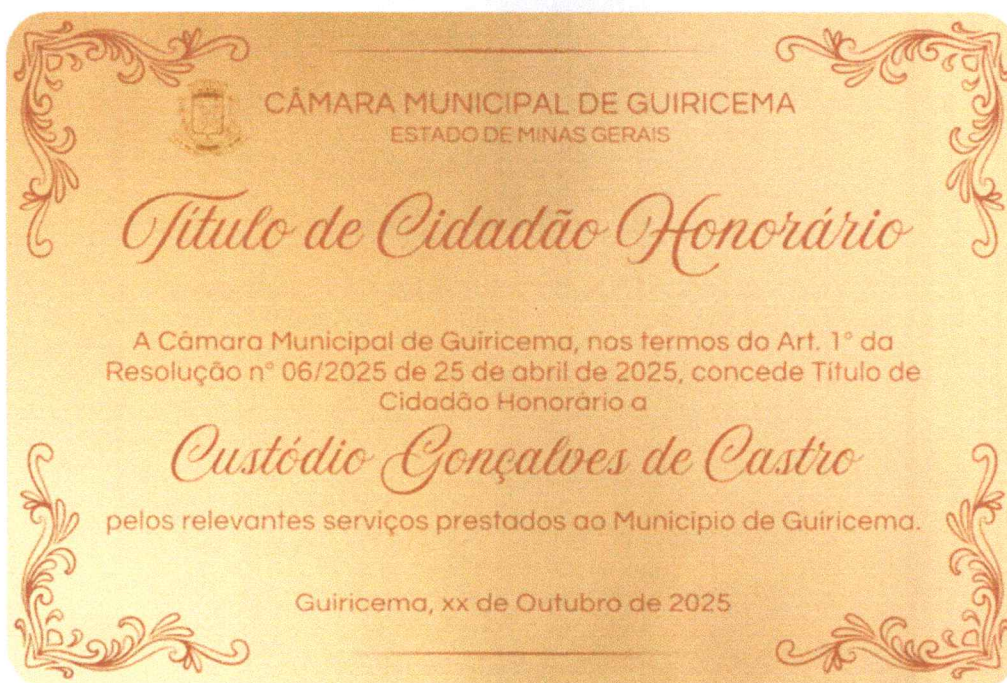
Imagem de referência dos LOTE 1 , referente aos ITENS 1 E 2 – Placas de homenagem Cidadão Benemérito e Cidadão Honorário personalizadas no estojo.

Seguem as imagens ilustrativas para fins de referência e modelo dos itens objetos desta Dispensa de Licitação.